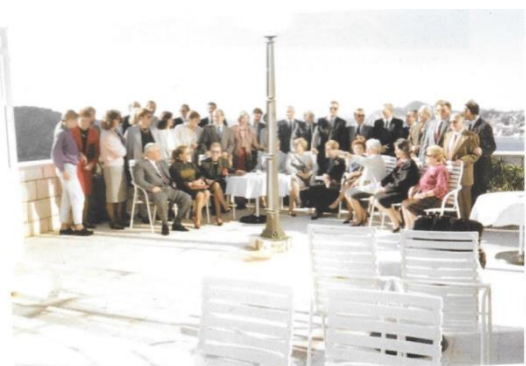
Prvi službeni sastanak Lionisa u Hrvatskoj – Poslije osnivačke skupštine LC Sv. Vlaho u dubrovačkom hotelu „Belvedere“, 20. listopada 1990. godine