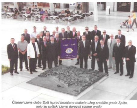
Članovi Lions kluba Split ispred brončane makete užeg središta grada Splita, koju su splitski Lionisi darovali svome gradu